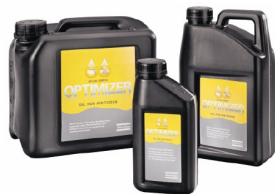
Olio per utensili pneumatici