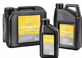
Olio per utensili pneumatici