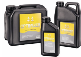
Olio per utensili pneumatici