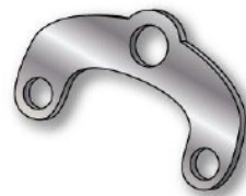
Suspension yoke 4112 3001 54