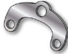
Suspension yoke 4112 3001 54