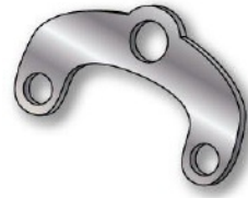
Suspension yoke 4112 3001 54