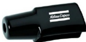
Protective cover 4112 0396 00