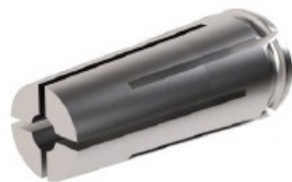
Collet 3 mm 4150 0081 00