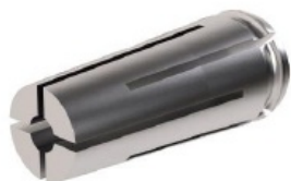
Collet 1/4" 4150 0076 00