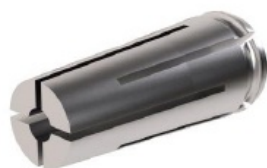
Collet 3/16" 4150 0649 00