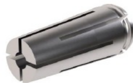
Collet 1/8" 4150 0082 00