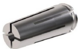
Collet 5/32" 4150 0648 00