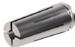
Collet 8 mm (5/16") 4150 0074 00