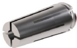
Collet 5 mm 4150 0075 01