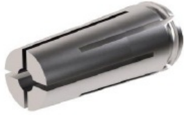
Collet 3/16" 4150 0649 00