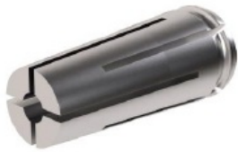
Collet 3 mm 4150 0081 00