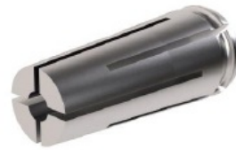
Collet 5/32" 4150 0648 00