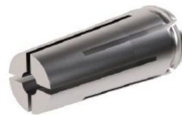
Collet 6 mm 4150 0075 00