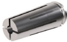
Collet 1/8" 4150 0082 00