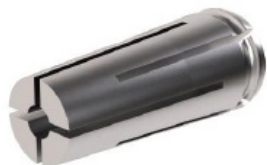
Collet 5 mm 4150 0075 01