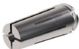
Collet 5/32" 4150 0648 00