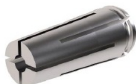
Collet 3/16" 4150 0649 00