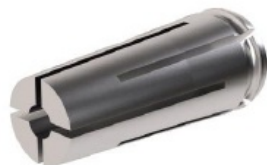
Collet 3 mm 4150 0081 00