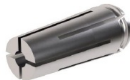
Collet 1/8" 4150 0082 00