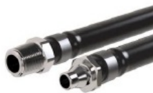
Hose kit Cablair 10; 10 mm, L = 0.9 m 4150 1617 80