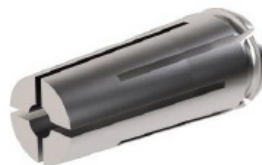
Collet 6 mm 4150 0075 00