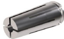
Collet 5 mm 4150 0075 01