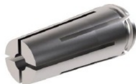
Collet 1/8" 4150 0082 00