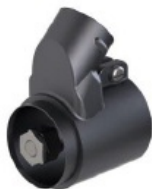
Dust extraction kit Use with Diamond coated drum 3780 5035 00 (orderable separately) 3780 4011 73