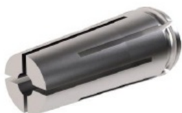
Collet 3/16" 4150 0649 00