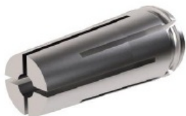
Collet 3 mm 4150 0081 00