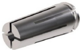
Collet 1/4" 4150 0076 00