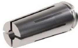
Collet 8 mm (5/16") 4150 0074 00