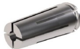
Collet 5/32" 4150 0648 00