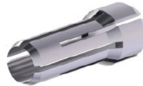
Collet Ø3,16 to 3,96 mm (Ø5/32") 4150 2226 47