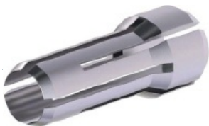
Collet Ø3,95 to 4,75 mm (Ø3/16") 4150 2226 48