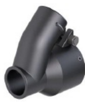
Dust extraction kit 3780 3015 23