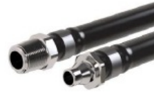
Hose kit Cablair 08; 8 mm (5/16"), L = 0.9 m (L = 3 ft) 4150 1689 80