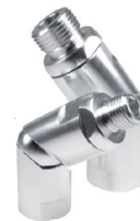
MultiFlex Swivelling type, BSP 8202 1350 20