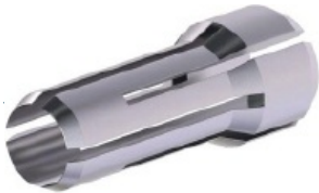
Collet Ø1,7 to 2,5 mm (Ø3/32") 4150 2226 45