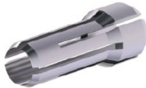
Collet Ø2,4 to 3,2 mm (Ø1/8") 4150 2226 46