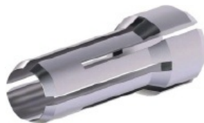
Collet Ø4,75 to 5,55 mm (Ø7/32") 4150 2226 49