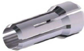
Collet Ø0,4 to 1,2 mm (Ø3/64") 4150 2226 43