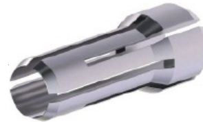
Collet Ø1,2 to 2 mm (Ø5/64") 4150 2226 44