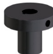
Flange washer 4150 1650 01