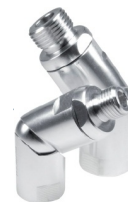
MultiFlex Swivelling type, BSP 8202 1350 22