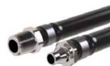
Hose kit Cablair 10; 10 mm, L = 0.9 m 4150 1617 80