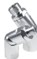
MultiFlex Swivelling type, BSP 8202 1350 22