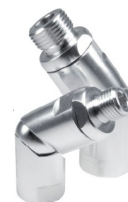
MultiFlex connector Swivelling type, BSP 8202 1350 22