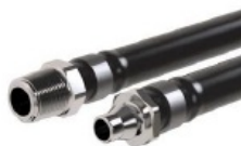
Hose kit Cablair 10; 10 mm, L = 0.9 m 4150 1617 80