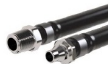
Hose kit Cablair 10; 10 mm, L = 0.9 m 4150 1617 80